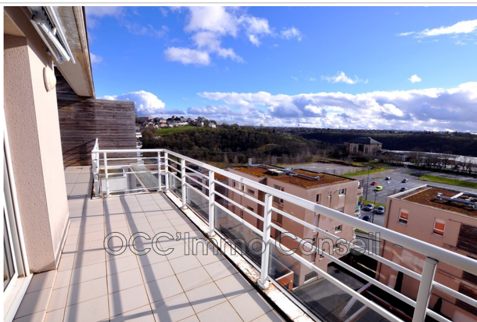
Apartment 7 Rodez